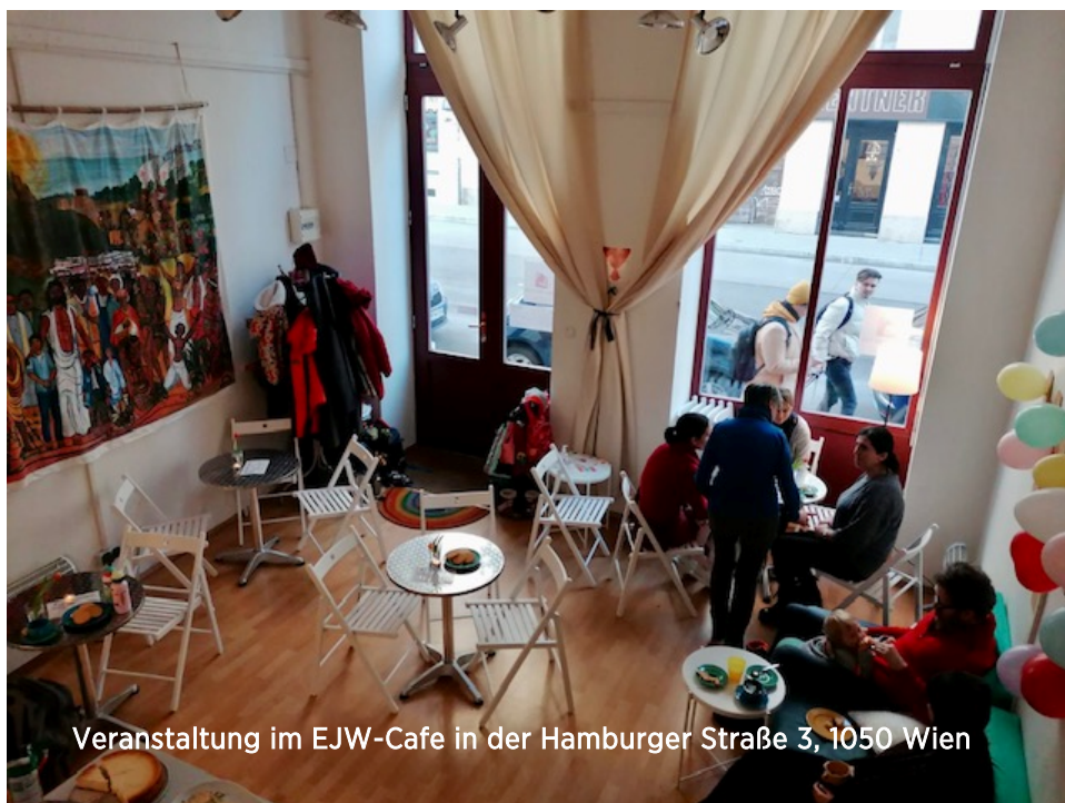
Veranstaltung im EJW-Cafe in der Hamburger Straße 3, 1050 Wien