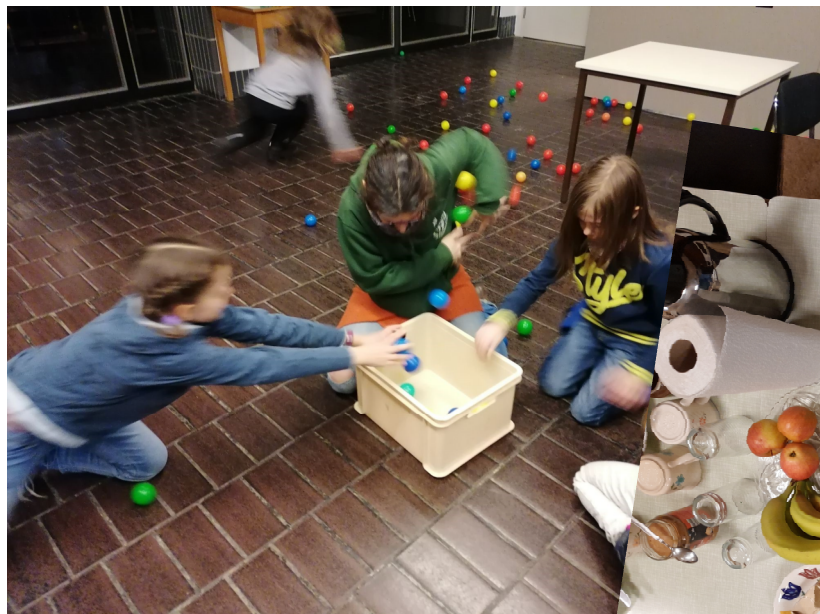
Eindrücke aus unserer Veranstaltung MUMelade Frühstück für Eltern und Kinder